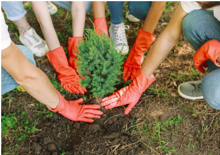
Bordure Verte, projet du budget participatif de Haren, 2021

Ces idées, proposées par les habitant.es, peuvent ensuite être concrétisées en projets avec l'aide des services communaux concernés . Après une phase de vote, les projets retenus sont mis en œuvre soit directement par les services de la Ville, en collaboration avec les citoyens, soit directement par les habitant.es, avec le soutien des services et d'un subside pouvant aller jusqu'à maximum 20.000 € .