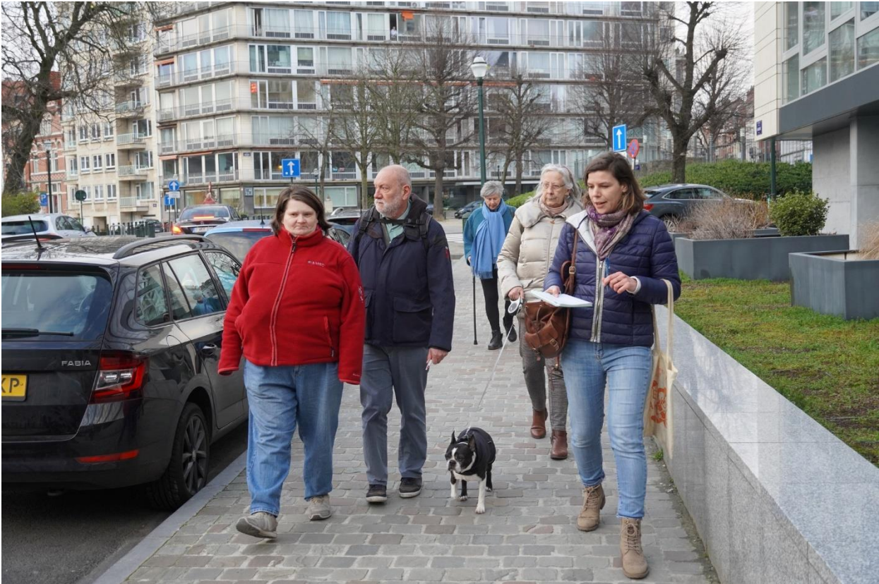
Balade exploratoire pour identifier des murs potentiels.