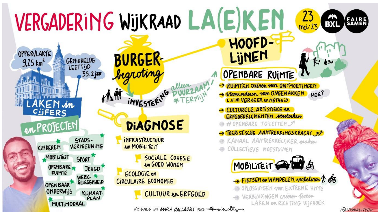
Visuele samenvatting van het diagnostische werk en de keuze van de thema's voor de burgerbegroting van Laken.